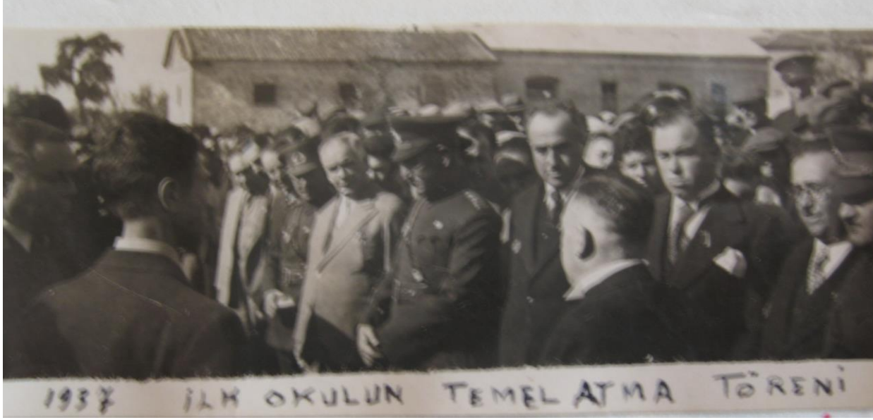
1937 yılında Camivasat Mahallesinde yeni bir okul yapımına başlanır.

Okulumuz 1901 yılında bu günkü Halk Eğitimi Merkezi olarak kullanılan binada eğitimine başlamış olup, o tarihte Karesi Bursa'ya bağlı olmasından dolayı okula o dönemin Bursa Valisi olan Tevfik Beyin adına ithaf en TEVFİKİYE OKULU adı verilmiştir. İstiklâl Savaşından sonra Gazi İlyas Okulu bu binaya taşınır ve okula BİRİNCİ İLYAS OKULU adı verilir. Daha sonraki yıllarda KIZ MEKTEBİ ve NUMUNE MEKTEBİ olarak eğitimini sürdürmüş, 1928 yılında İstiklâl Okulunun da buraya taşınması ile birlikte bu tarihten itibaren CUMHURİYET OKULU adını almıştır.